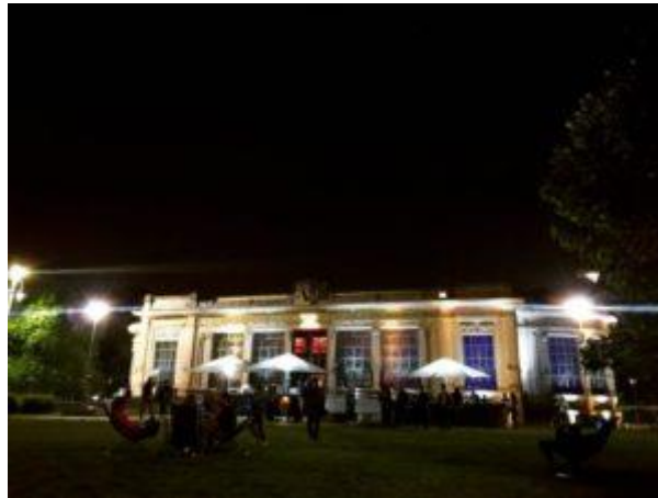
Esterno palazzina Liberty, stile hyde park

L'inaugurazione ufficiale ha avuto luogo venerdì sera alle 21.00 ai giardini della Galleria d'arte moderna con il concerto di Aziza Mustafa Zadeh , pianista, compositrice, cantante e anche pittrice, di nascita azera. E da lì, il via per 48 ore, quasi ininterrotte, di spettacolo itinerante, conclusosi domenica sera con il concerto, sempre alla Gam, di Vinicio Capossela . Quest'anno i due poli principali della manifestazione erano il Piano center diurno e il Piano center notturno. Il primo la Galleria d'arte moderna, appunto, con l'enorme area verde ma anche con alcune sale interne, che da sempre è il cuore pulsante della manifestazione. Il secondo è la Palazzina Liberty, dove venerdì e sabato notte è stato possibile assistere ai concerti di musica classica, elettronica e sperimentale, all'interno o all'esterno del parco, grazie a delle cuffie wireless, da mezzanotte alle cinque del mattino. Super novità di quest'anno è stata Piano alba, con la possibilità di veder sorgere sull'acqua il sole in due location meravigliose, dalle cinque di mattina in poi: i Bagni Misteriosi e l'Idroscalo.